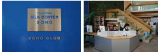
OpenDolphin Labは横浜 山下公園入口シルクセンタービルにある。