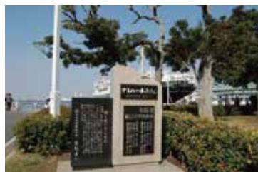
カモメの水兵さん歌碑