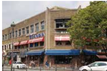
レストラン スカンディア