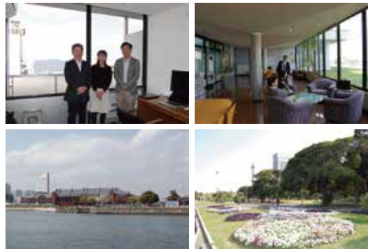
開発室からは横浜ベイブリッジ、山下公園が見える。

経済産業省の公募プロジェクトで2001年から2002年に開発され、当時の名称はeDolphinでした。コンセプトは現在のバージョンと変わっていません。2004年にオープンソース化し、名称をOpenDolphinに変更し、現在、「OpenDolphin」は診療所向け電子カルテとして、幅広い支持を頂いております。