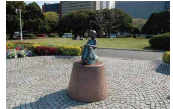
OpenDolphinには「赤い靴を履いた少女」をモチーフとした「赤い靴」のアイコンが使われている。

オープンソースのOpenDolphinは今日まで継続的に改善が加えられ2001年当時のオリジナルコードのほとんどが新しい機能追加やクラウド化のための重要なアップデートを反映しています。