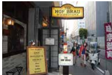
レストラン ホフブロウ