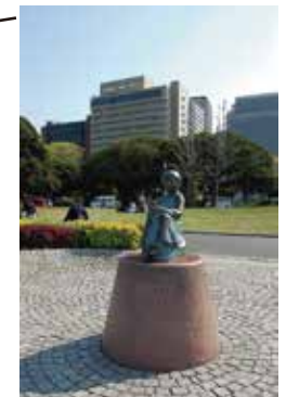
赤い靴はいていた女の子像